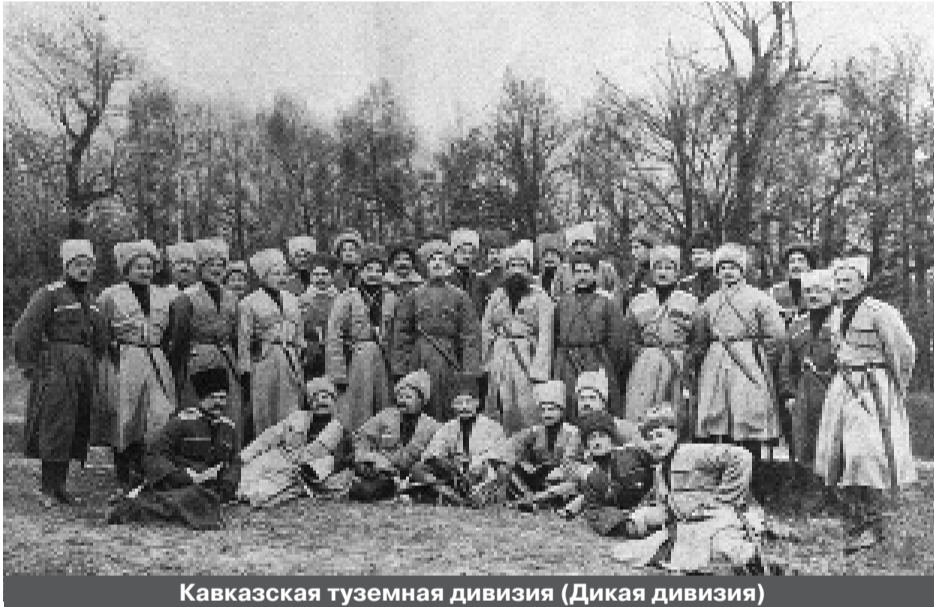
Кавказская туземная дивизия (Дикая дивизия)