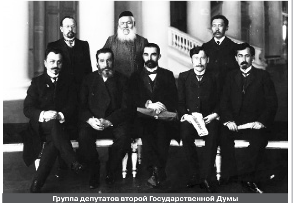
Группа депутатов второй Государственной Думы